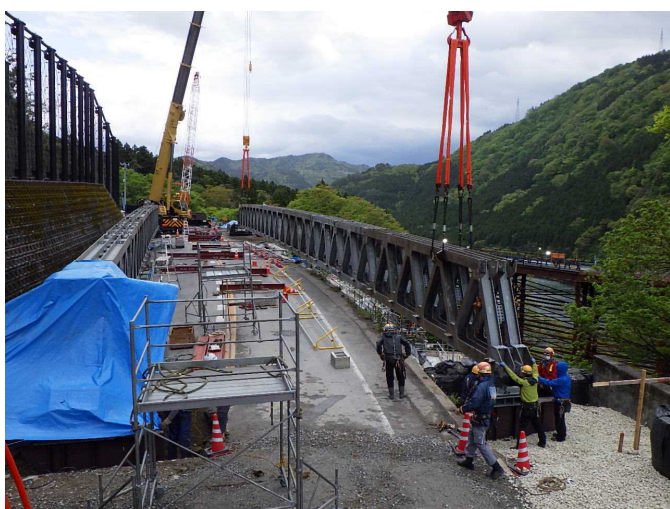
応急組立橋の主桁架設状況 [撮影:令和2年5月10日]