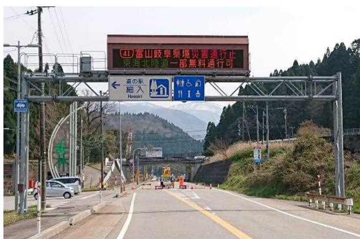
「道の駅」細入から岐阜県側を望む