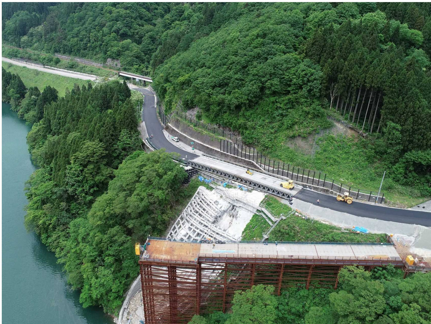
応急組立橋等による国道の復旧状況(富山市側から岐阜県側を望む) [撮影:令和2年5月22日]