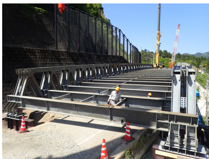
応急組立橋の床桁架設状況 [撮影:令和2年5月11日]