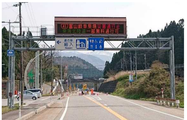
「道の駅」細入から岐阜県側を望む