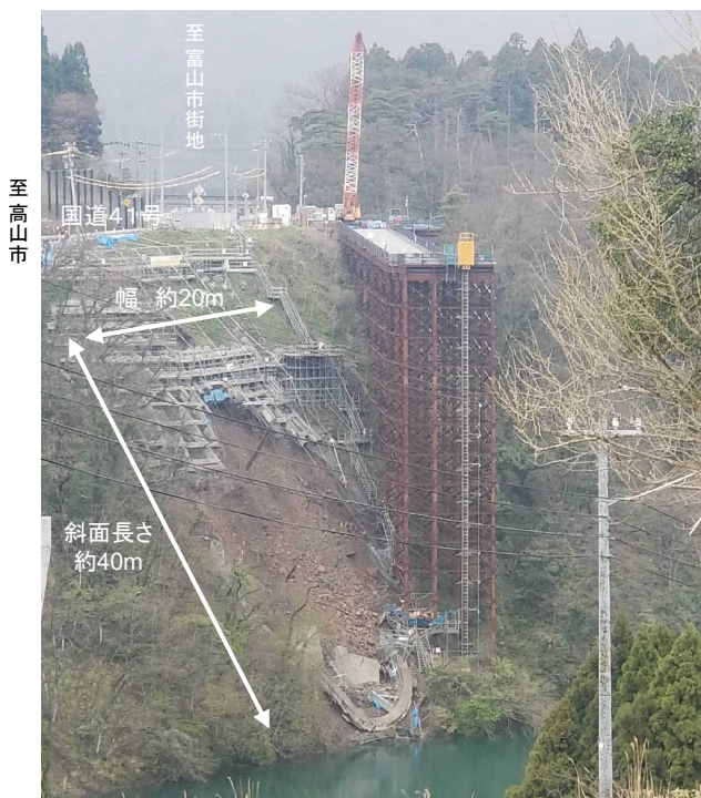
対岸より全景写真(➡撮影方向)