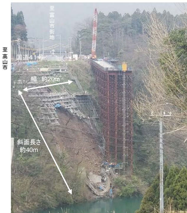
対岸より全景写真 (➡ 撮影方向)