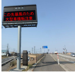
表示イメージと表示例

暴風警報等が発表された際に、巻バイパスの前後の道路情報板で注意を呼びかけていますので、ご注意ください。