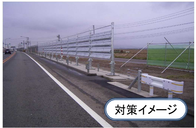
国道116号 新潟市西区田島地先▶