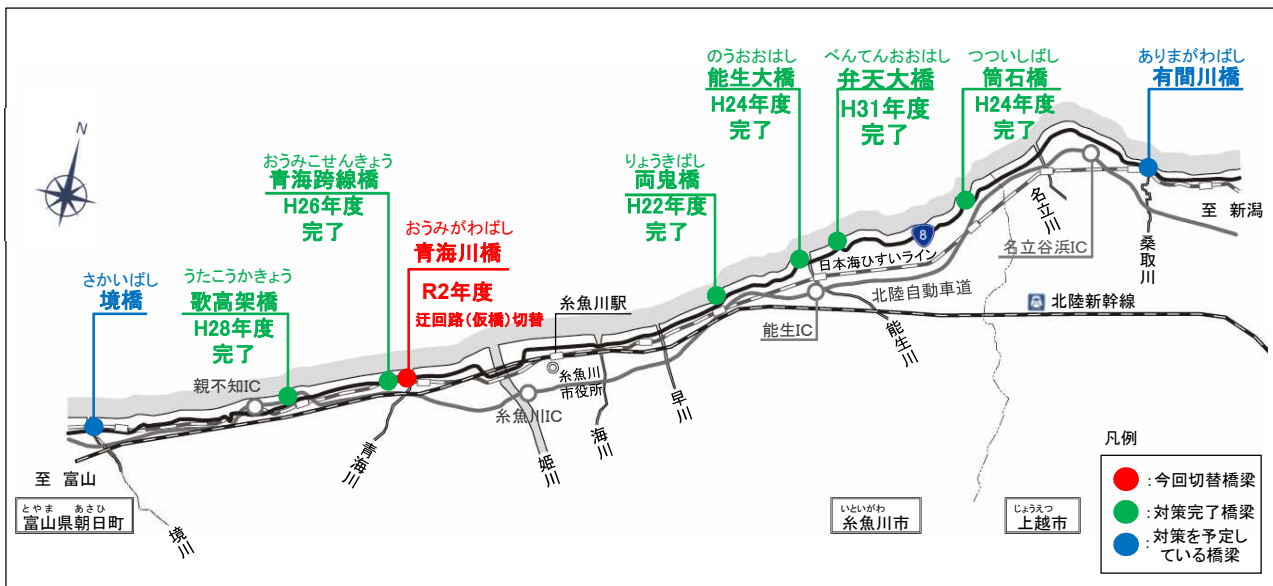
対策を予定している橋梁