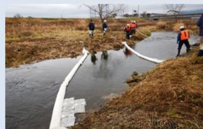
H30訓練実施時の様子