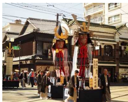
【藤崎八幡宮例大祭の神幸行列】

国指定の重要文化財「熊本城」を核として、周辺に広がる城下町一帯を行列が練り歩く藤崎八幡宮例大祭、また、史跡「熊本藩川尻米蔵跡」を有し、かつて港町として栄えた町並みを背景に行われる河尻神宮秋季大祭などにより形成される、歴史的な風情を有する良好な市街地の環境の維持向上を図るため、熊本地震により被災した「熊本城」をはじめとする歴史的建造物の保存修理・修景や、市内の歴史的建造物を回遊するための道路の美装化、歴史・文化を活かした観光体験事業等を位置づけています。