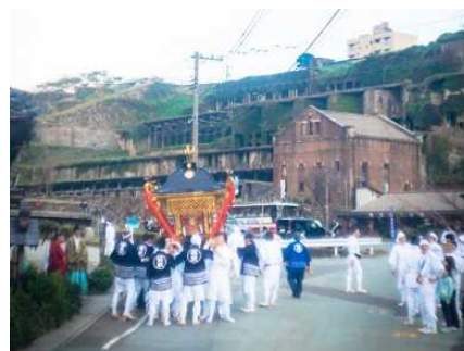
【佐渡市】善知鳥神社祭礼

国指定の重要文化財「旧佐渡鉱山採鉱施設」、国指定の史跡「佐渡金銀山遺跡」及びその周辺の鉱山町一帯と、善知鳥神社祭礼や鉱山祭とそこで披露される郷土芸能、無名異焼の製造・販売等が一体となった、歴史的な風情を有する良好な市街地の環境の維持向上を図るため、歴史的建造物の保存修理、公有化した旧深見家住宅等の歴史的建造物を活用した拠点施設整備、それら歴史的建造物を回遊するための道路の美装化等の事業や、相川音頭を踊るイベントの宵乃舞など、地域行事の運営に対する支援を位置づけています。