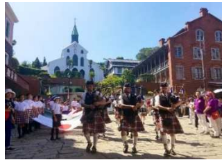
【長崎市】長崎居留地まつり