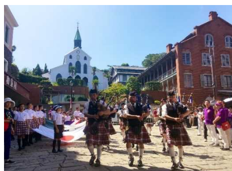
【長崎居留地まつり】

国宝「大浦天主堂」や国指定の重要文化財「旧グラバー住宅」、及びその周辺地域と、歴史的建造物等の保存活動の一環として始まった長崎居留地まつりや大浦諏訪神社の大浦くんち等の伝統的な活動が一体となった、歴史的な風情を有する良好な市街地の環境の維持及び向上を図るため、旧グラバー住宅をはじめとする歴史的建造物の保存修理や、夜間景観の整備、景観を損なう空き家の除却等の事業を位置づけています。