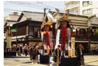
【熊本市】藤崎八幡宮例大祭の神幸行列