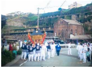
【佐渡市】善知鳥神社祭礼