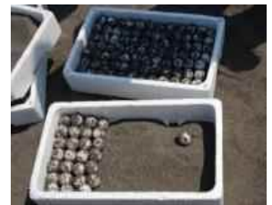
希少種保護 (ウミガメ卵の保護)