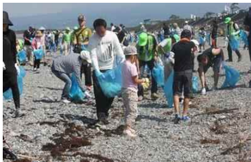
海岸環境の維持 (清掃活動)