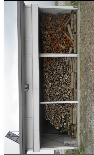
提供する樹木の集積状況