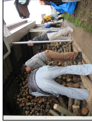
昨年（3/16） の配布状況 水防倉庫前での配布 となります