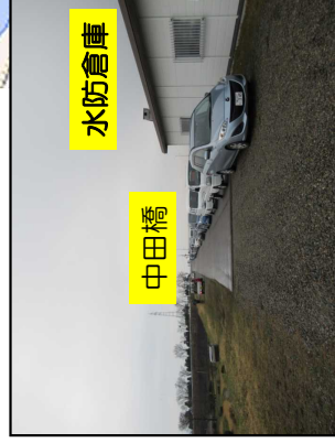
昨年の配布待状況 [10台前後配布待ち]