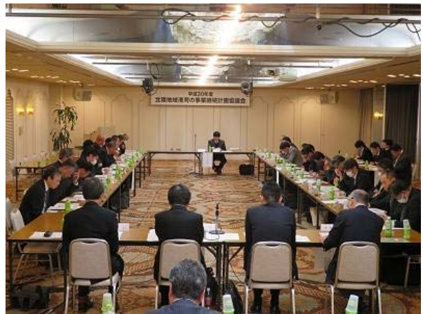
平成 30 年度 北陸地域港湾の事業継続計画協議会の状況