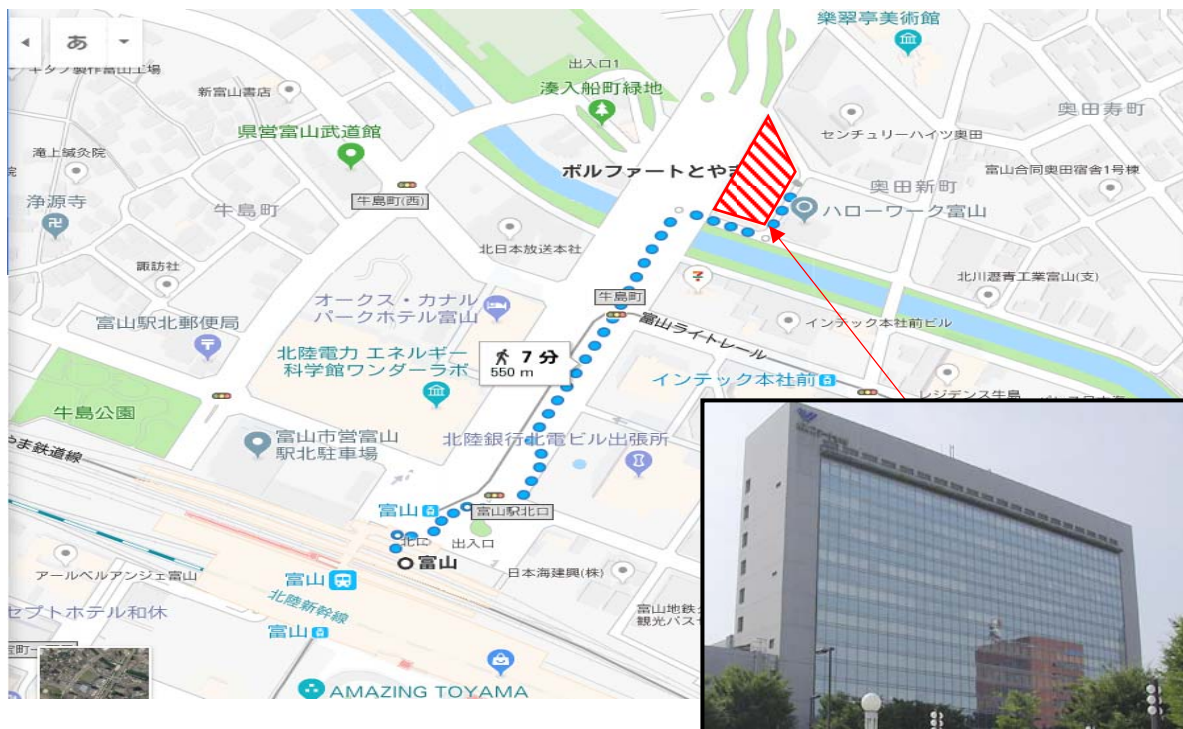
※ボルファートとやまのHPより引用