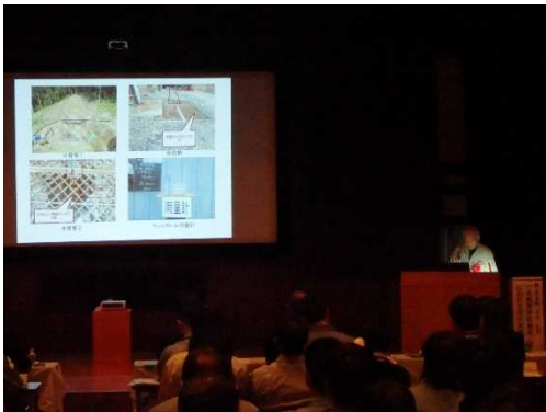
▲昨年度の論文発表状況