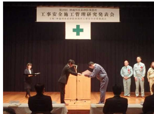
▲昨年度の表彰式の状況