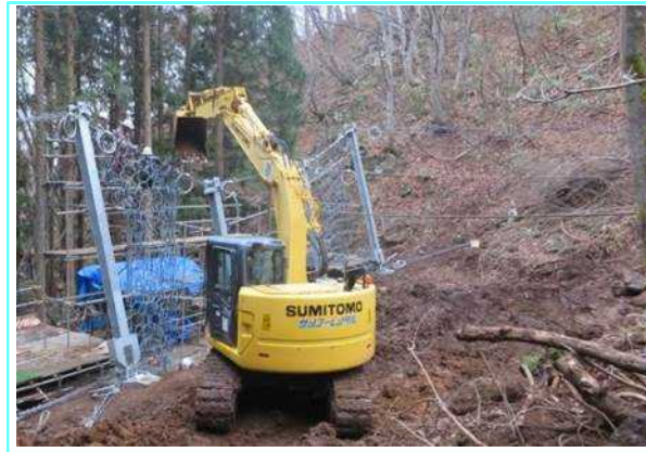
現地設置状況 11月27日（水）