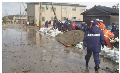
H20.2 水防活動状況(黒部市生地地先)