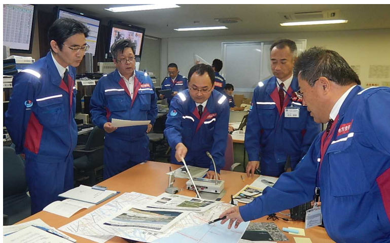
平成30年演習の様子(黒部河川事務所内)