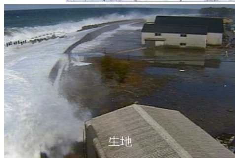
H20.2 黒部市生地地先の越波状況