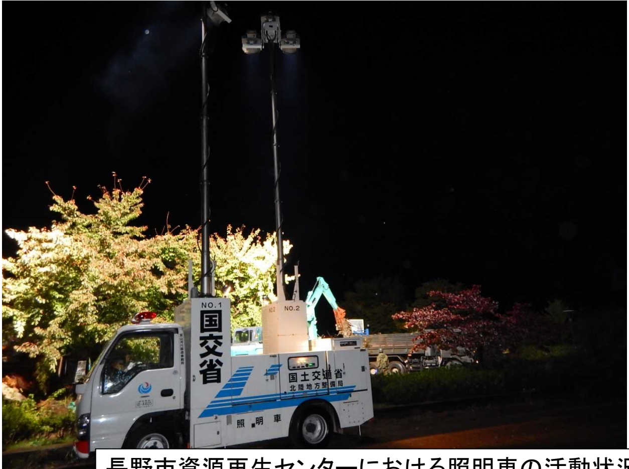
長野市資源再生センターにおける照明車の活動状況