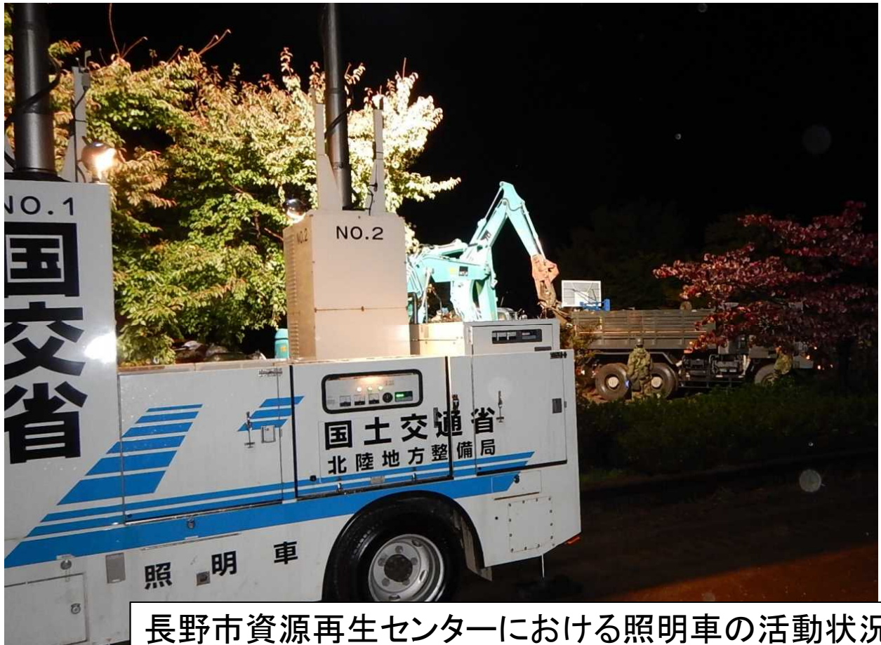
長野市資源再生センターにおける照明車の活動状況