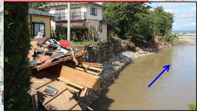
【千曲川：護岸崩壊】 長野県 佐久市 原地先～佐久穂町 高野町 地先