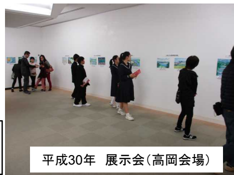
平成30年 展示会(高岡会場)