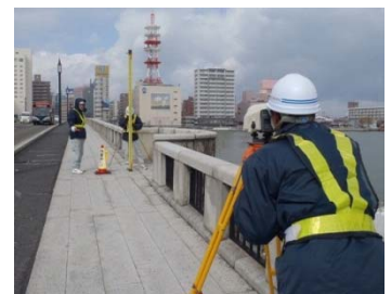
(観測鉾) 観測鉾の間隔を測量にて確認