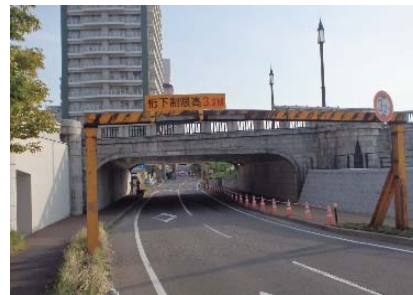
第8径間(新潟駅前側)