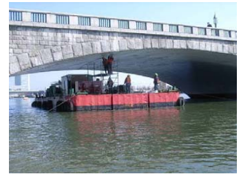
台船による橋梁定期点検