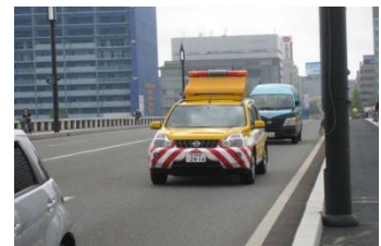
道路パトロール車による巡回

道路巡回点検は、萬代橋上を道路パトロール車により、目視にて、車道及び歩道部の路面や高欄等の道路施設及び道路利用状況を確認します。