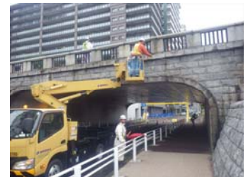
萬代橋に交差する市道上の点検

橋梁定期点検の2～3年後に、通行車両及び歩行者の安全・安心を目的に、萬代橋に交差する市道上の桁下に損傷がないか確認します。