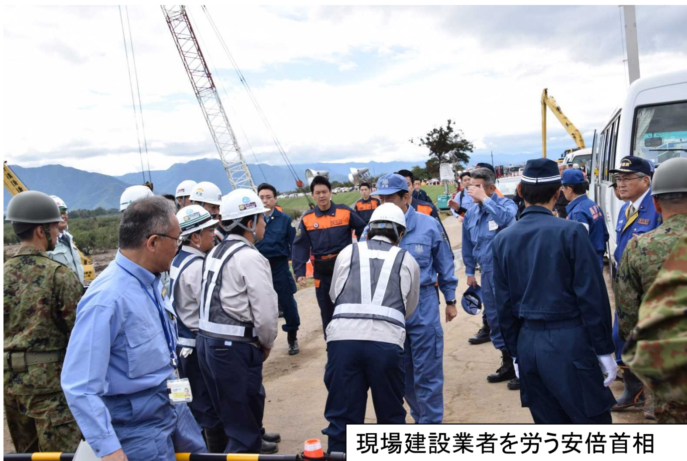
現場建設業者を労う安倍首相