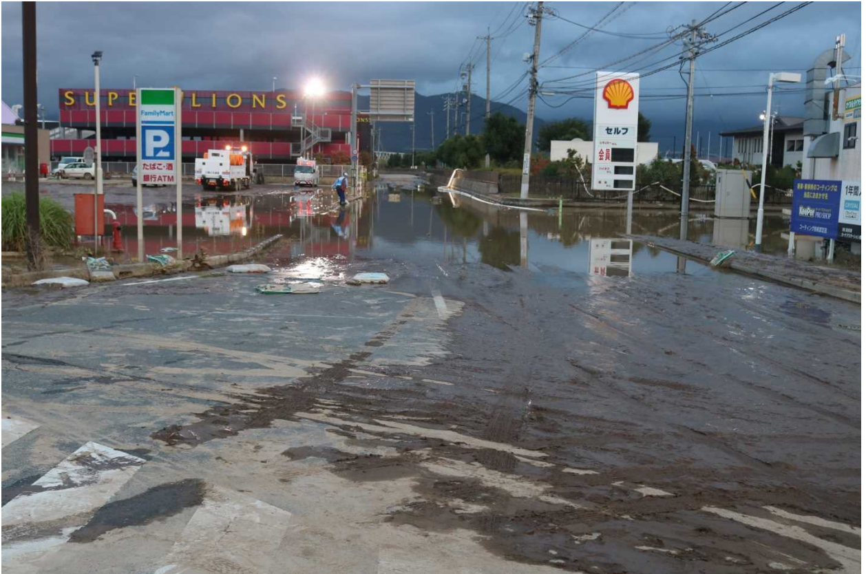
写真① 国道18号周辺の浸水が解消(長野市豊野町浅野付近)