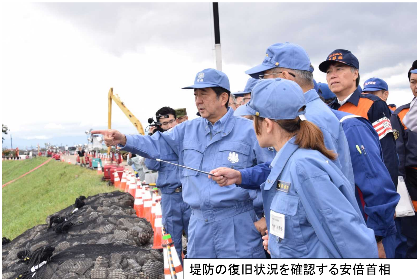
堤防の復旧状況を確認する安倍首相