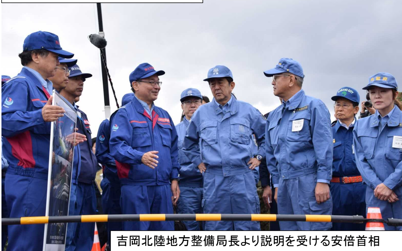
吉岡北陸地方整備局長より説明を受ける安倍首相