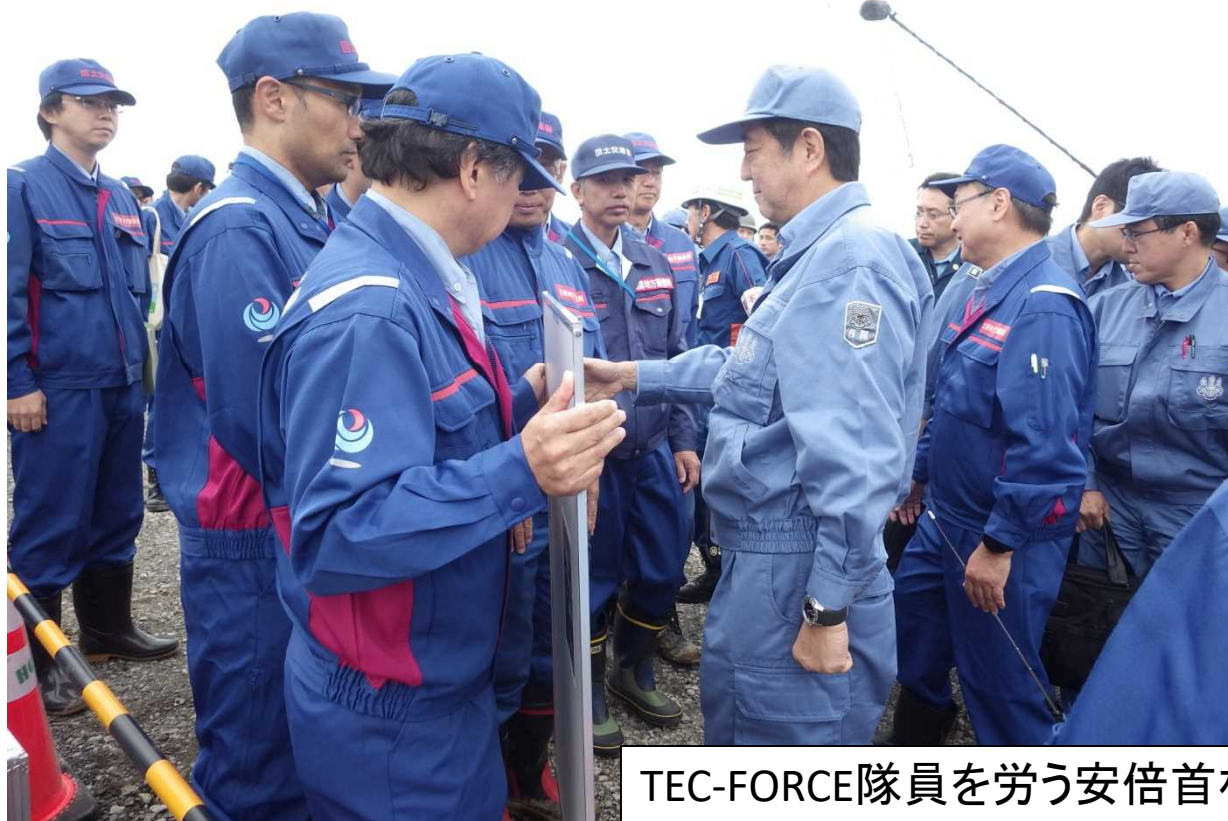
TEC-FORCE隊員を労う安倍首相