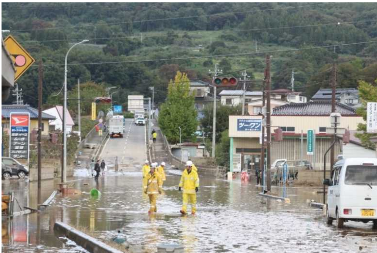
写真② 県道の浸水が解消(長野市豊野町豊野付近)