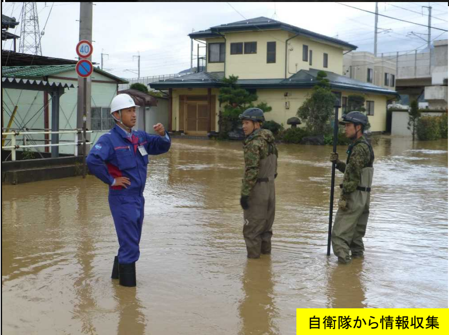
自衛隊から情報収集