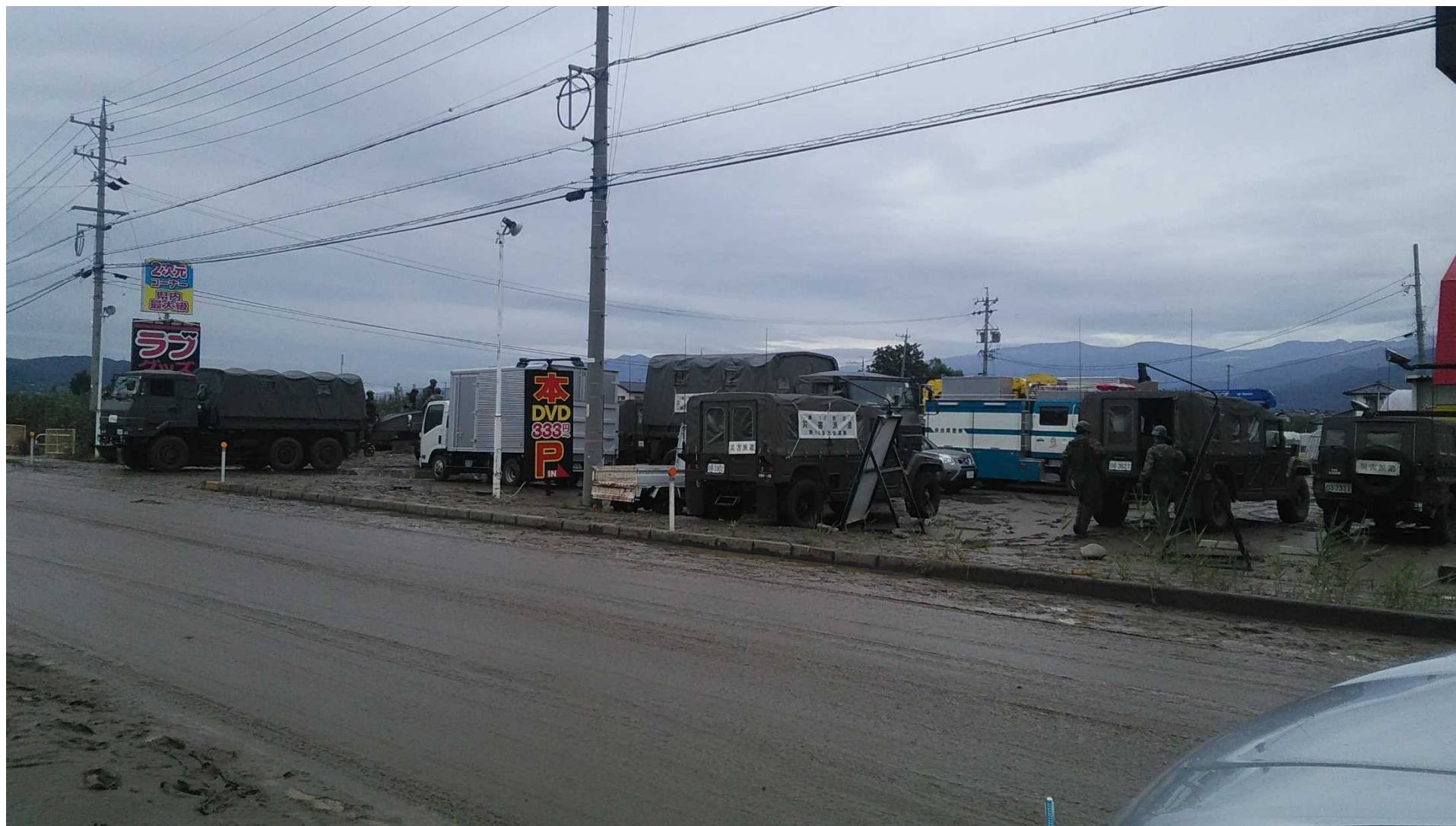
写真① 10月14日 12時15分