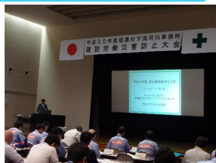
昨年度の建設労働災害防止大会