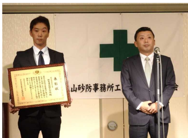
安全管理優良受注者紹介