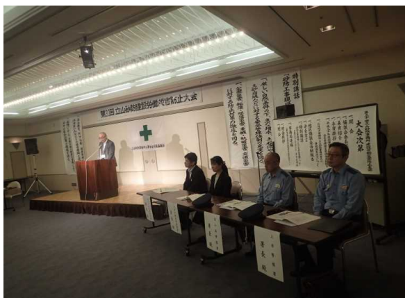
会場状況(ひな壇側)