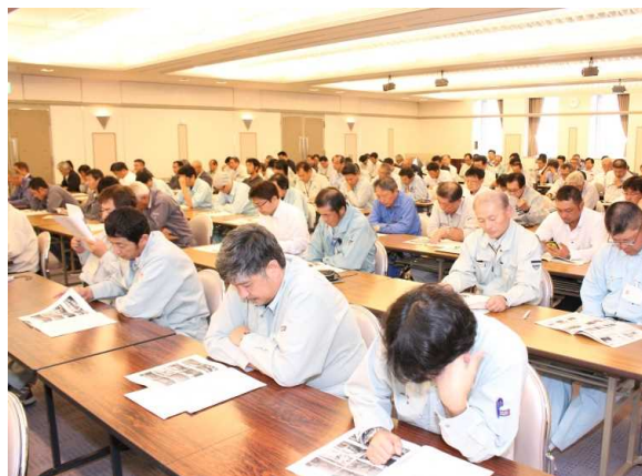
会場状況(会員席側)