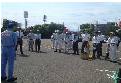
昨年度の活動状況