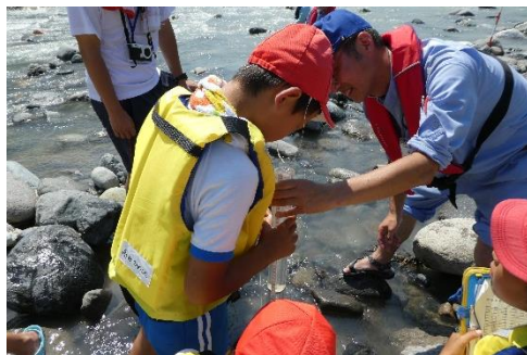
透視度計を使って濁り具合を調査