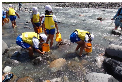
川にすむ生きものを採集