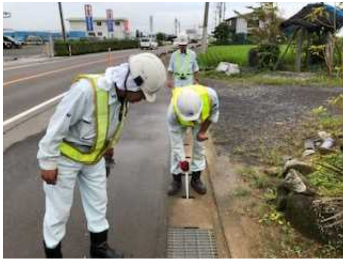
9月2日 現地調査 (佐賀県杵島郡白石町)