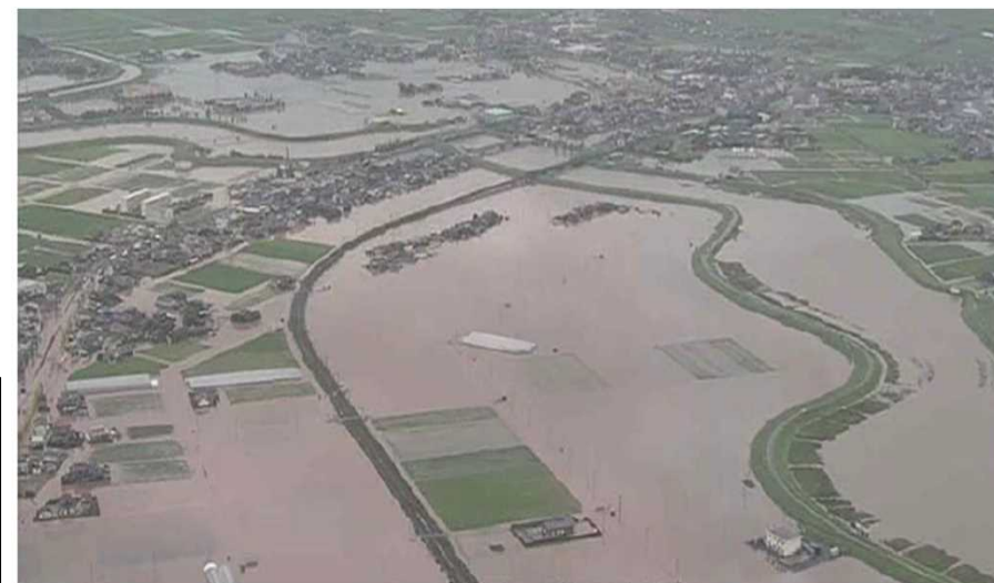
九州地方整備局 はるかぜ号より撮影(R1.8.28) 牛津川上空から被災状況確認(佐賀県小城市)