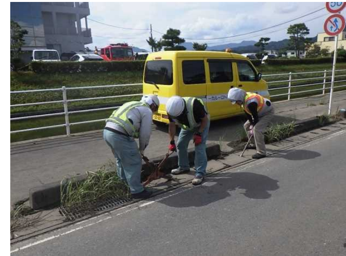
9月3日 側溝清掃 (佐賀県杵島郡大町町)