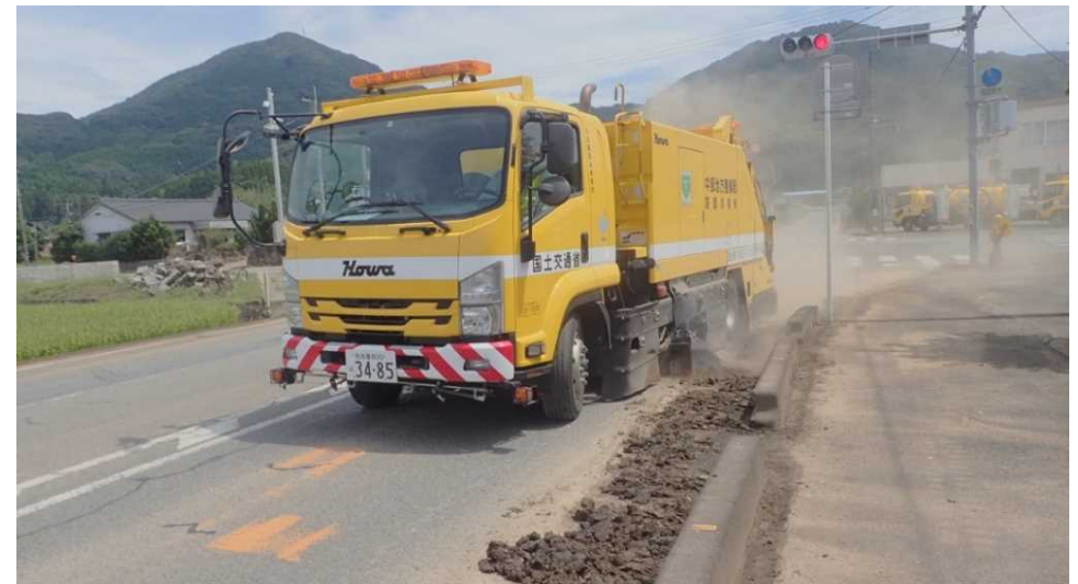
路面清掃車活動状況