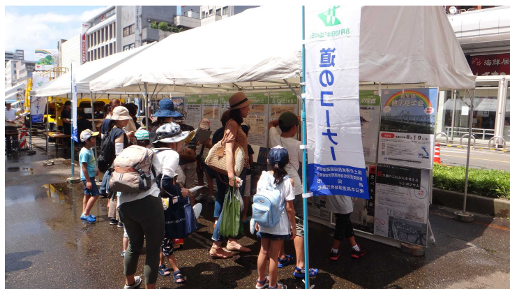
「パネル展示コーナー」の様子