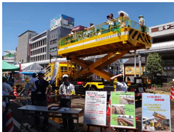
昨年の「道のコーナー」

主 催：国土交通省長岡国道事務所 新潟県長岡地域振興局地域整備部 長岡市土木部 東日本高速道路株式会社新潟支社長岡管理事務所 一般社団法人北陸地域づくり協会