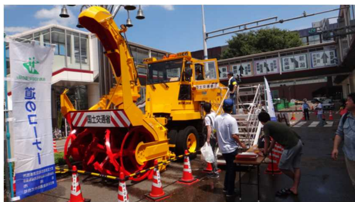
「ロータリ除雪車」展示・試乗の様子