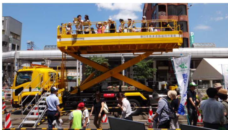
「高所作業車」展示・試乗の様子