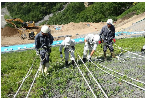
山腹工でのロープ作業