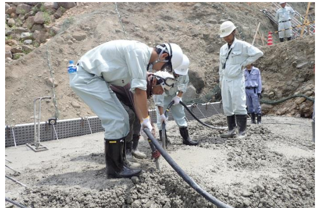
砂防堰堤のコンクリート打設