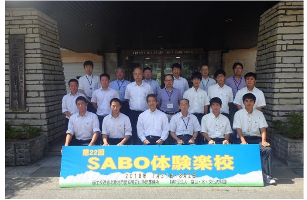
開校式後の記念撮影