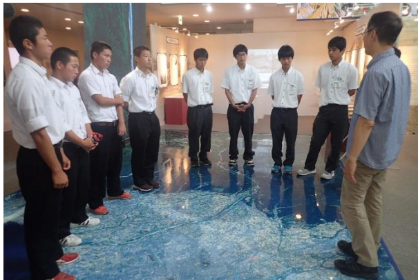
立山カルデラ砂防博物館見学