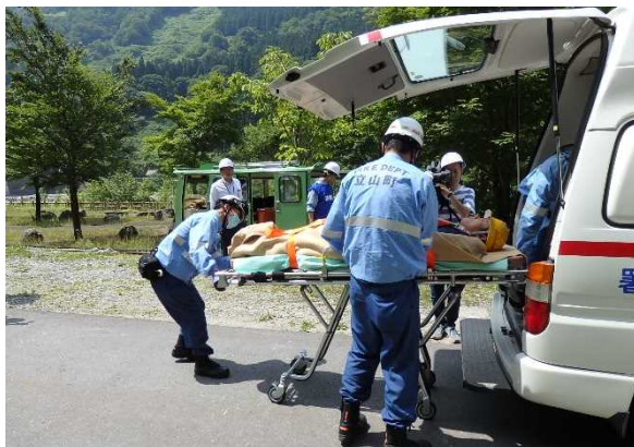
救急車による搬送（現地）