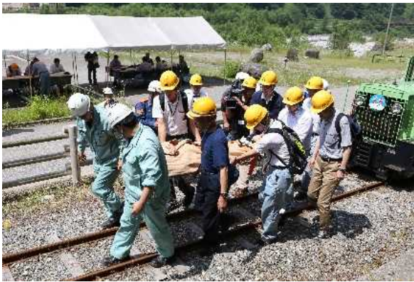
重傷者の応急手当、搬出（現地）