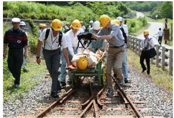
レスキューカートによる搬送（現地）