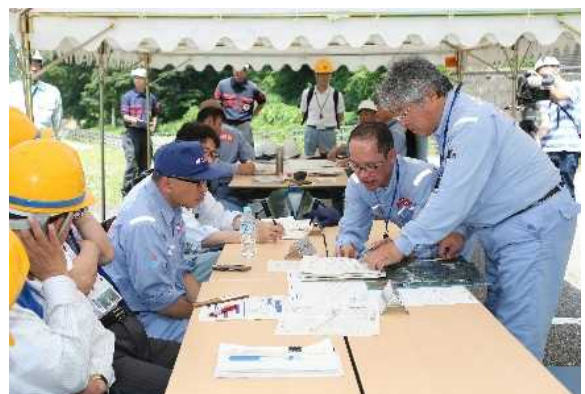
事故対策本部情報伝達（現地）