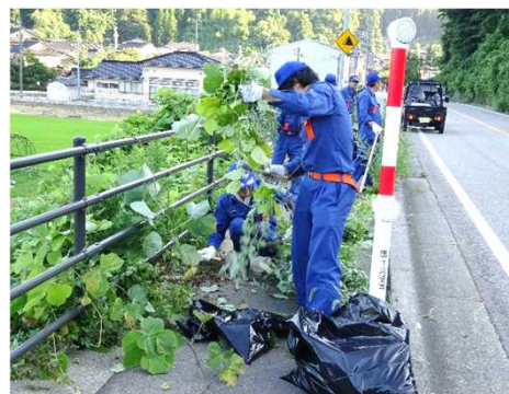
【平成30年7月22日の清掃活動状況】 写真(左)：氷見市窪付近 くぼ 、写真(右)：氷見市姿付近 すがた