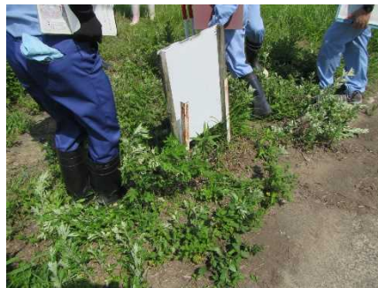
6 月 26 日 看板破損 (手取川)