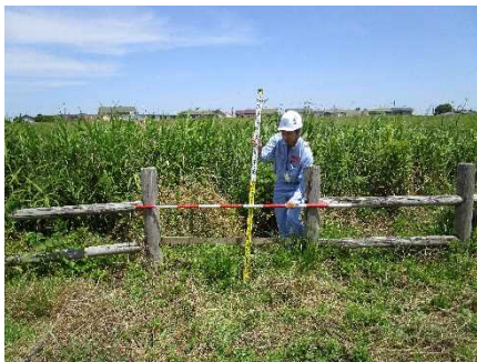
6 月 26 日 木柵損傷 (梯川)