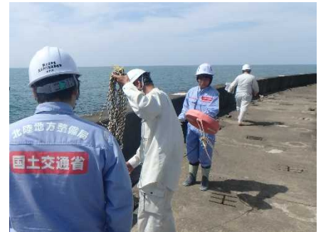
6 月 26 日 点検状況 (海岸)