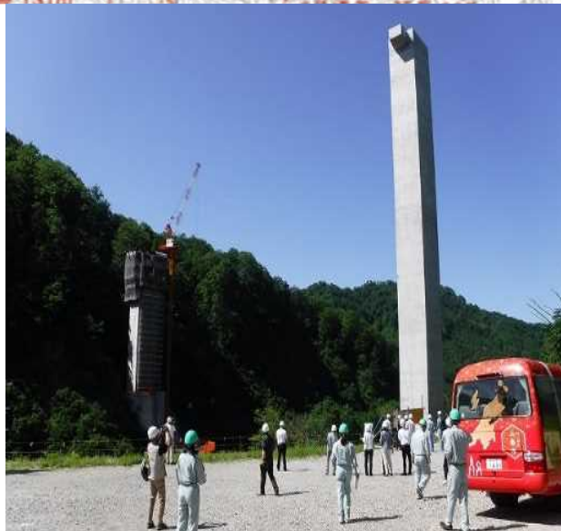
橋梁名称は仮称です。