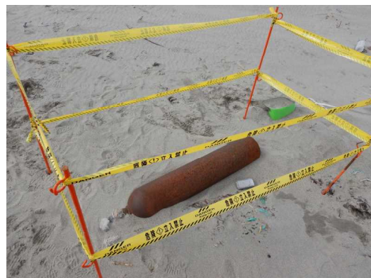
海岸漂着物発見後、立ち入り禁止措置を実施