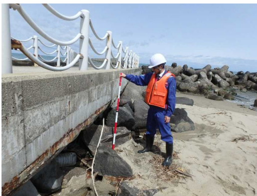
異常吸出し箇所の有無を調査