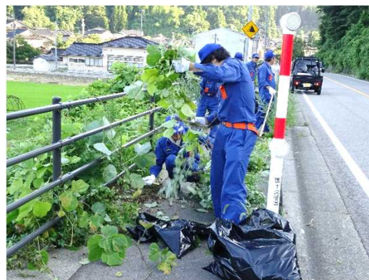
【平成30年7月22日の清掃活動状況】 写真(左)：氷見市窪付近 くぼ 、写真(右)：氷見市姿付近 すがた