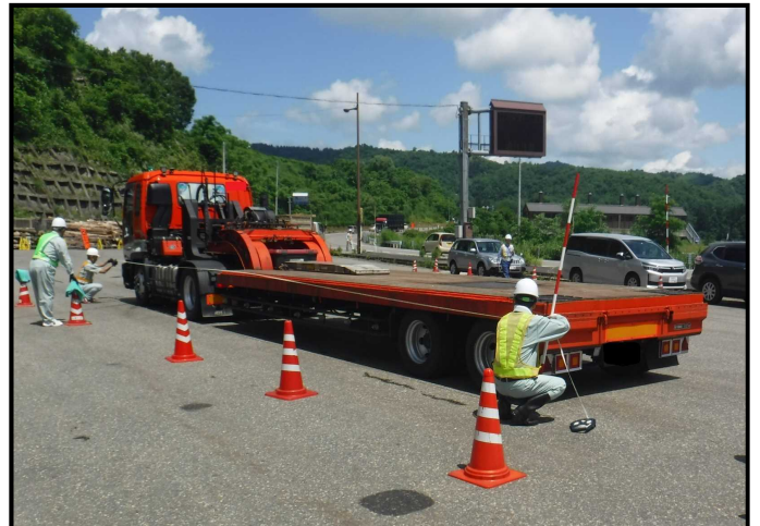
対象車両の寸法を計測しています。