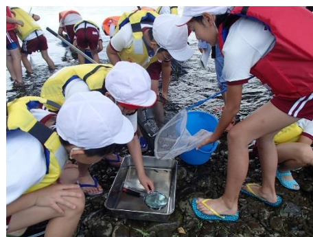
採集した水生生物を判定