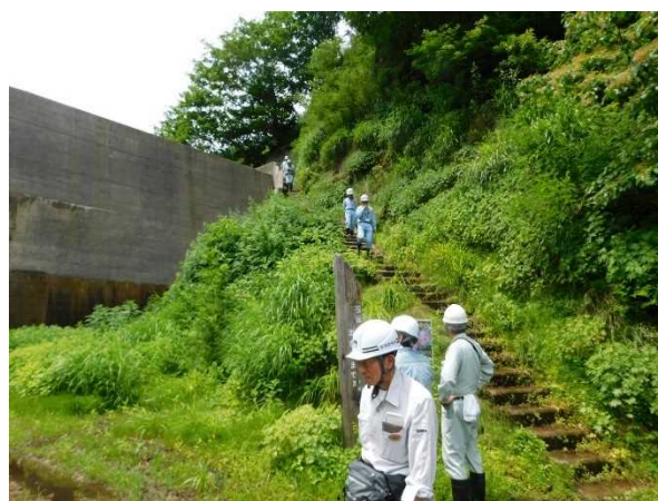
梅花皮沢第4号砂防堰堤付近 点検状況