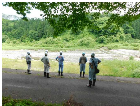
荒川流路工 点検状況