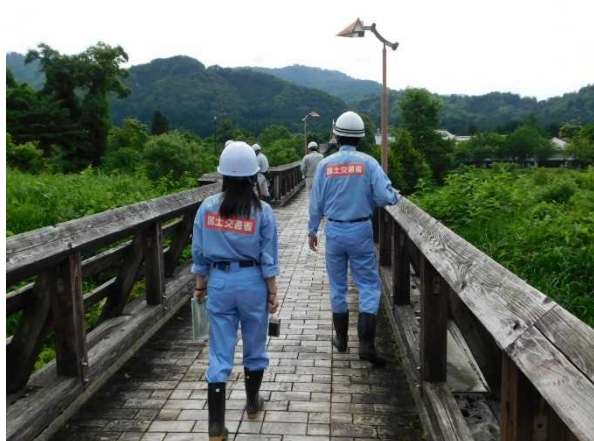
荒川流路工付近（かじか橋） 点検状況