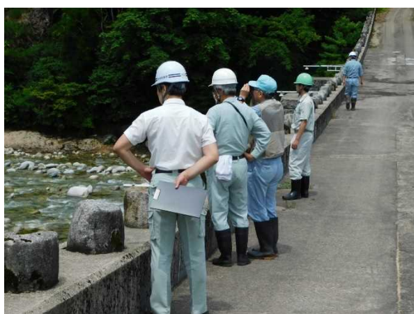
玉川スーパー暗渠砂防堰堤 点検状況