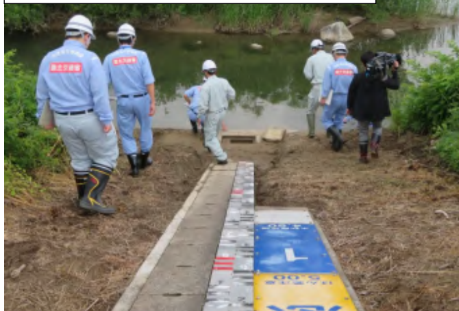
H30神通川 神通大橋水位観測所点検状況