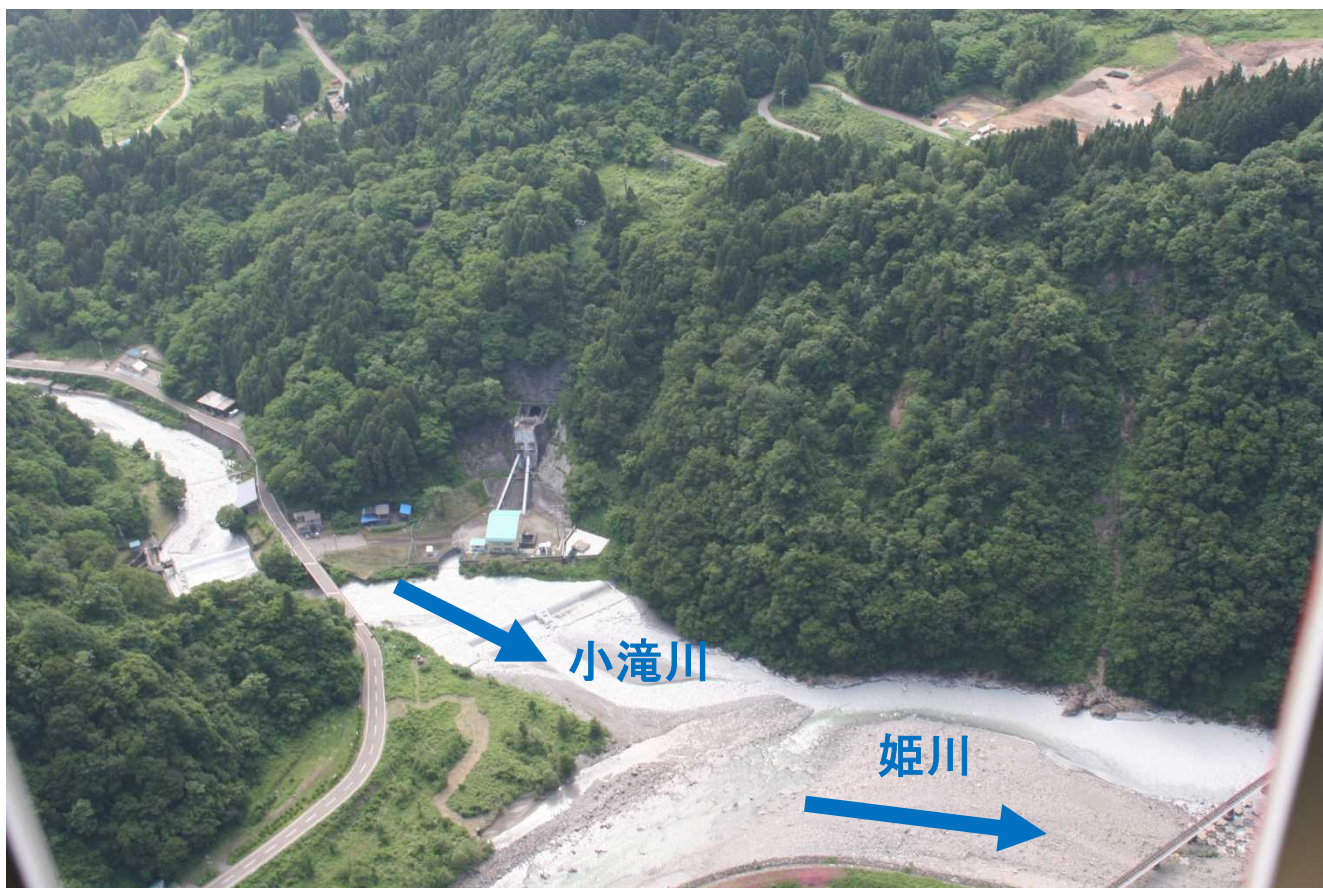
写真-3 小滝川と姫川の合流点