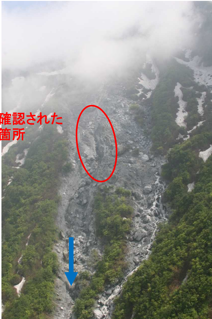
写真-1 東俣沢源頭部(崩壊地の状況)