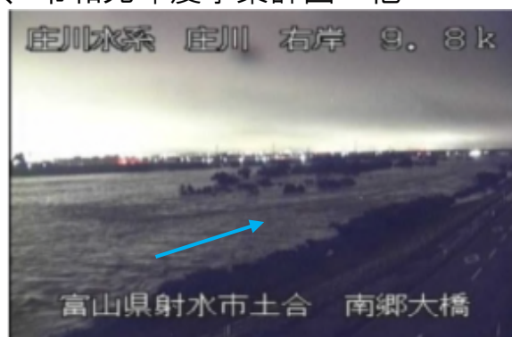
出水状況 (H30. 7. 7)