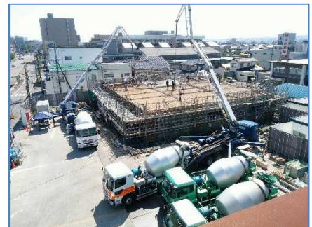
コンクリート打設の状況