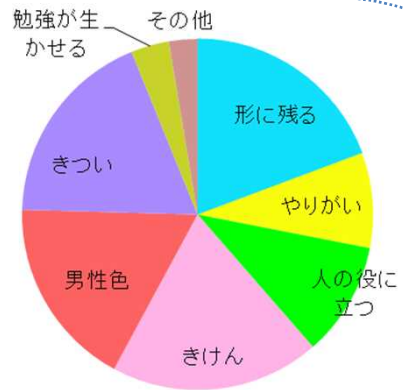
工事現場のイメージ

現場における最近の取組紹介、意見交換等を通じて、建築工場の現場の魅力を感じてもらえるよう進めることとしています。