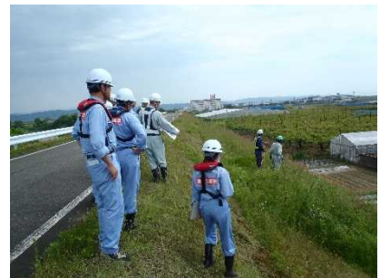
平成30年度の点検状況