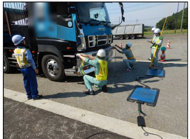
対象車両の重量・寸法を計測しています。