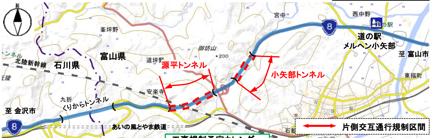
工事規制予定カレンダー

気象条件等により、規制方法や工事日程に変更が生じることがありますので、当日の規制情報は、 交通情報 および 道路情報板 をご確認ください。