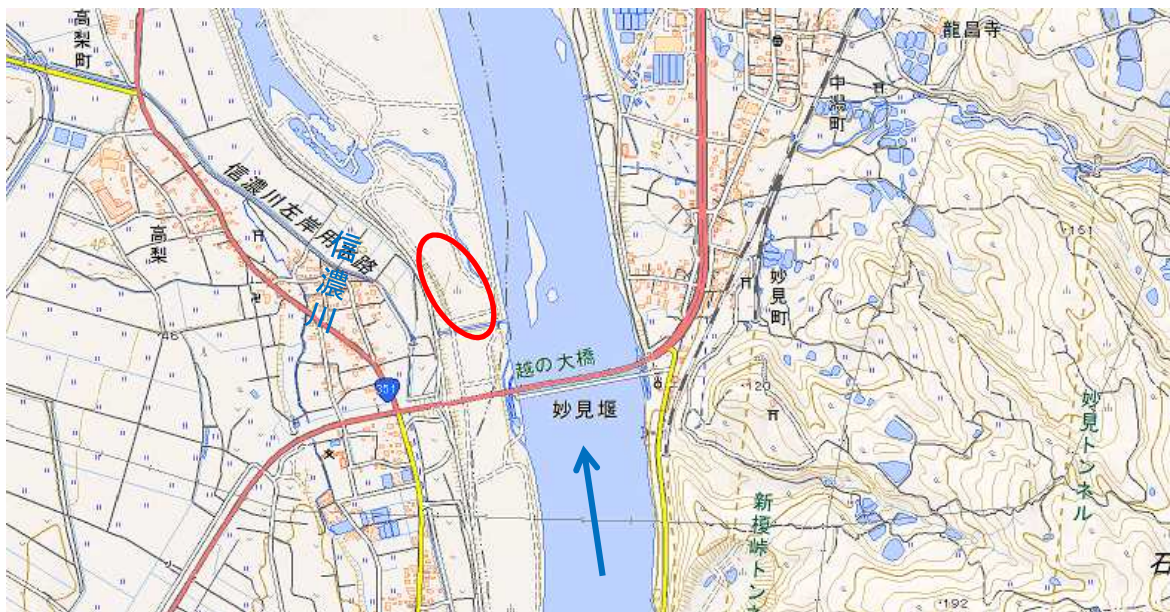
5月23日(木):信濃川(十日町地域)水防訓練