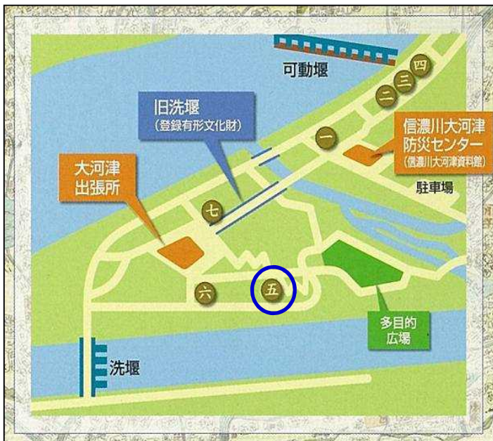
石碑・記念碑の位置図

大河津出張所の周辺には、慰霊碑の他にも大河津分水路工事に関わる石碑・記念碑があります。