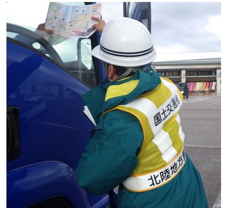
H30.12.19 調査状況 (道の駅 万葉の里高岡)

12月9日には富山河川国道事務所管内で初除雪を行います。「スリップ事故」「坂を登れない」等で他の道路利用者の迷惑にならないよう、 雪道は安全走行をお願いします。