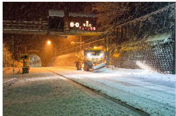
ふくとり 除雪トラック(国道49号阿賀町福取地先)