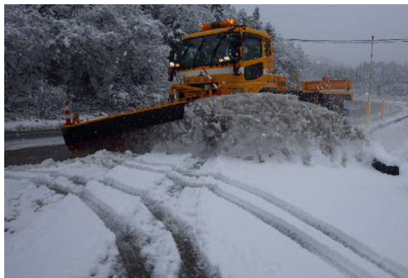
しもかわぐち 除雪トラック(国道113号関川村下川口地先)