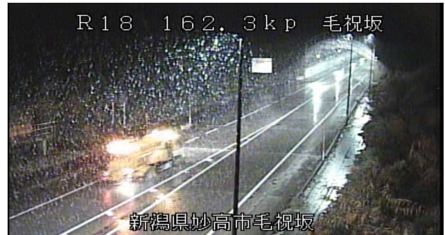
新潟・長野県境毛祝坂トンネル付近 散布状況