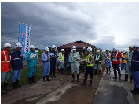
現場視察状況イメージ写真

栗林地区河道掘削その3工事の 工事現場にお越しの際は、安全のため、 ヘルメット、長靴の着用をお願い致します。