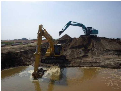
栗林地区河道掘削その3工事 現場写真（7月時点）