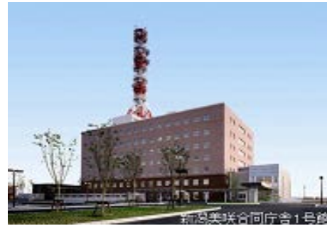
新潟美咲合同庁舎1号館 (2階 港湾空港会議室)