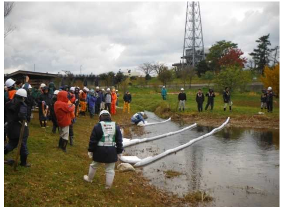
<他河川での訓練の様子>

【内 容】 講話 ・油流出事故対応における留意点 実技訓練（参加者 39名） ・ロープワーク ・オイルフェンスの設置 ・吸着マットの設置